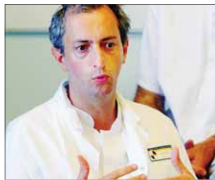
► 50 % des greffés du cœur sont en vie dix ans après l'intervention.