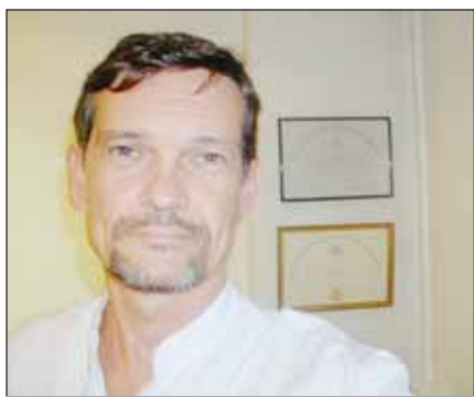
► Cette année, déjà 21 greffes ont été réalisées à Marseille, note le Pr Thomas.

"C'est la greffe pulmonaire qui a eu le plus de mal à décoller en France", explique le Pr Thomas. Après la première transplantation, réalisée à Marseille en 1988 par les Pr Metras et Noirclerc, la pénurie de greffons a freiné le développement de cette activité. "Organe très fragile, le poumon n'est viable que sur un donneur sur 5". La révision en 2005 des critères d'acceptabilité de l'Agence de biomédecine commence à porter ses fruits. Ainsi, en 2009, 21 greffes pulmonaires ont pu être réalisées à Marseille (sur un total national d'environ 220 chaque année), la plupart chez des adultes. Mais l'offre reste très insuffisante : à Marseille, une trentaine de pa-