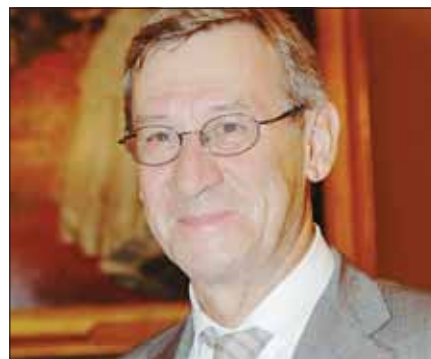
► Les équipes marseillaises sont les plus performantes en France.

Le prix d'une année de dialyse se situe entre 50 000 et 80 000€ par patient, contre environ 8 000€ pour une greffe. Autant dire qu'au-delà même du confort de vie qu'elle apporte aux malades, la transplantation rénale est avantageuse pour toute la collectivité. Avec plus de 100 greffes par an et 1300 patients greffés suivis, le CHU de Marseille est celui qui a la plus grosse activité en France. Ce sont aussi les équipes phocéennes qui affichent le temps d'ischémie (délai entre le prélèvement et la greffe) le plus court, 12 h en moyenne, grâce à une très grande disponibilité du personnel. Mais si les équipes marseillaises greffent beaucoup, elles