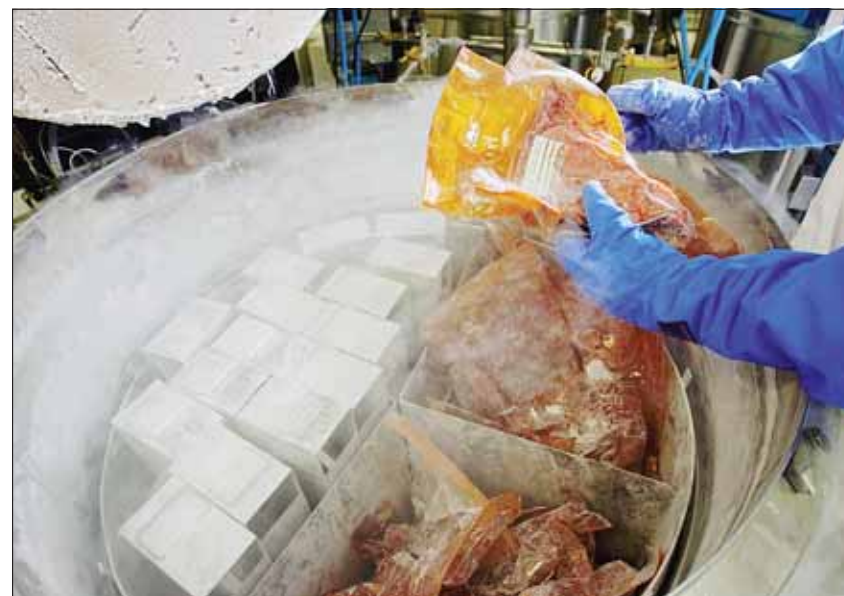
► La banque de tissus de l'Établissement Français du Sang. Des milliers de greffons sont stockés dans l'azote liquide à -150°.

tumeur, sur lequel ils seront réimplantés (autogreffe). Autre source de greffons : les résidus opératoires, avec l'accord des patients. Il s'agit le plus souvent de peau lors d'opérations de chirurgie plastique (réduction mammaire) et de têtes fémorales, cette boule située à l'extrémité du fémur, que l'on prend sur des patients opérés d'arthrose. Cassé en morceaux, ce ciment osseux sera utilisé sur un autre patient atteint de fractures multiples ou d'une tumeur. ■